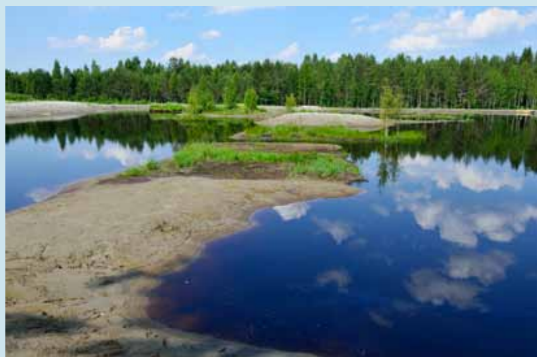
Ruukkisuon kosteikko.

Semmoset muistot on, kun kymmenvuotiaana tai vähän allekin ukin kanssa, tuon isänisän kanssa kalassa käytiin, se kepin kanssa kulukee nyttyttel tuonne järvelle. Mie olin soutumiehenä sitten, serkkupojan kanssakin aina porukassa oltiin ja olhan se tietysti Liisakin, siskotyttö apuna oltiin siellä. Se jäi vielä mieleen, kun tultiin tai menttiin, sitä piti aina mennä, mistähän se johtu, tuonne etemmä kallaan, että sitä ei ihan tästä piharannasta. Sitä piti mennä tuonne yläpähän järvee niin sanotusti. Ukilla oli tuo, semmosta kankaasta, oisko se nuista säkkillöistä tehynä purjeen. Sitä jos myötätuul sattu tullen tai männen, niin se nosti kepissä purjeen ja tultiin vappaalla poikkeen. Helepotti sitä soutumiehen hommaa, ja mukavahan se oli sieltä lieritellä hiljaa ku ei kummallakkaan, ei mulla ollu eikä ukilla ollu ennää kiirettä. Kyllähän niillä oli se, että ilimosta olivat tietosia silläkeinin, että sitä kallaankin lähettiin, kun heillä oli tiiossa, että kyllä se nyt kala liikkuu.