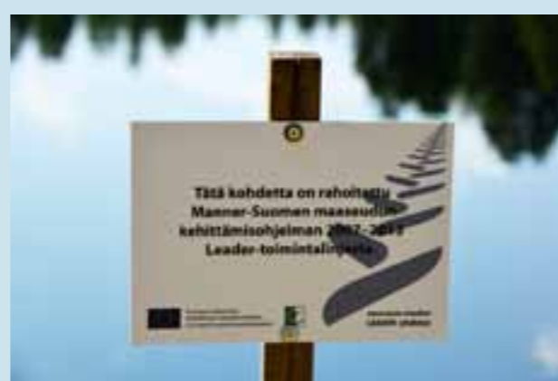
Jukajärvi – hanke sai tukea muun muassa LEADER –rahoituksesta.

Liistekatiska tai semmonen, järvenpohjaan oli lyöty, piti tietysti urkkii poikkeen sitte, ei sitä pystyny kallistamaan veneeseen sieltä. Kyllä se sai sieltä kallaa, siihen niin etes, tai meleko likellekin rantaan, ku siihen aikaanhan se syven tuosta, sittenkun tuo missä nyt on tuo rantapenkka niin rupes syvenemmään nopeasti, että meleko likellä rantaahan se oli.