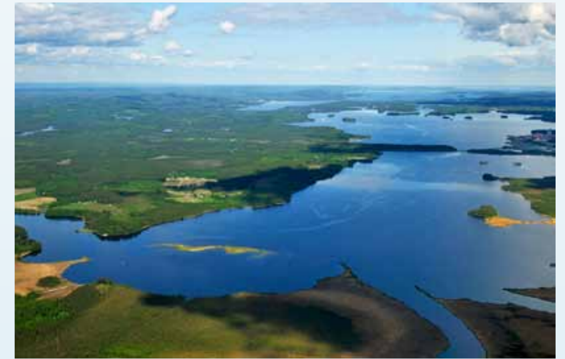
Pitkäranta, edessä Jukajoen suu.