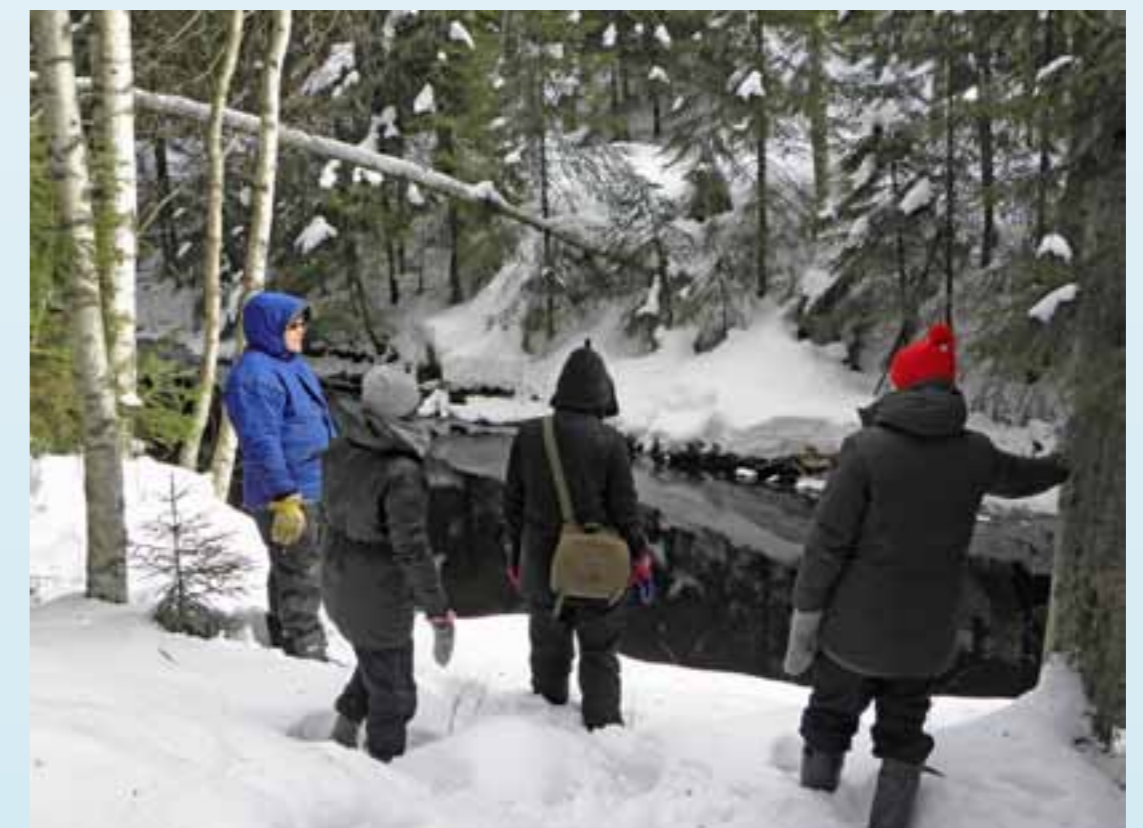
Lumimuutoksen hallitus tutustumassa Jukajoen tilanteeseen maaliskuussa 2013.